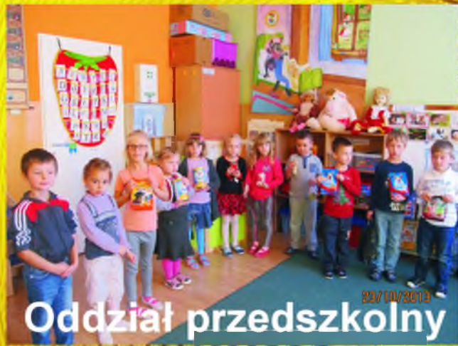
Oddział przedszkolny 22/10/2013

Reagujemy na apel nauczycieli. Pomagamy zwierzętom ze schroniska przynosząc dla nich karmę.